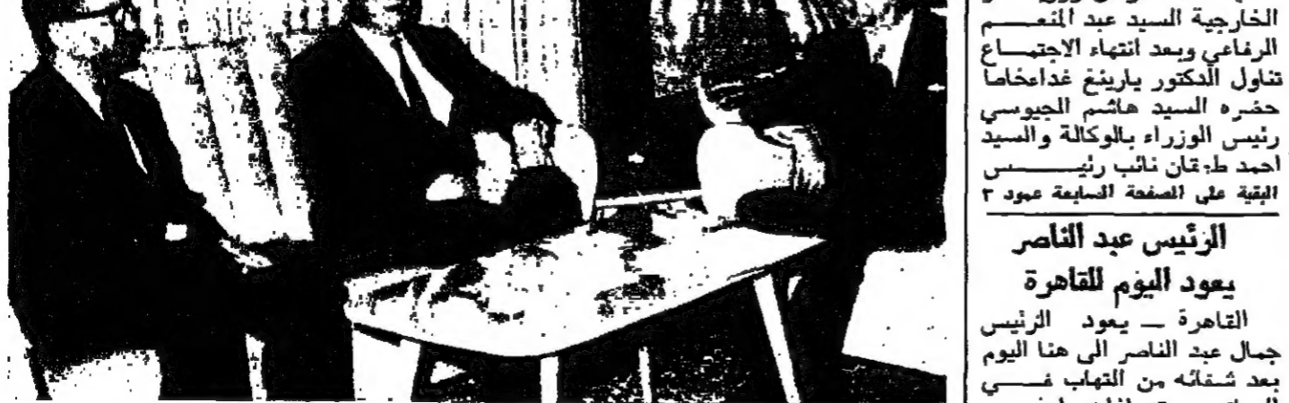
السيد احمد طوقان نائب رئيس الوزراء والسيد عبد القاسم الرفاعي وزير الخارجية لدى اجتماعهما بالمتنور فونان بارينغ امس

المباحثات ركزت حول تنفيذ إسرائيل لقرار مجلس الأمن